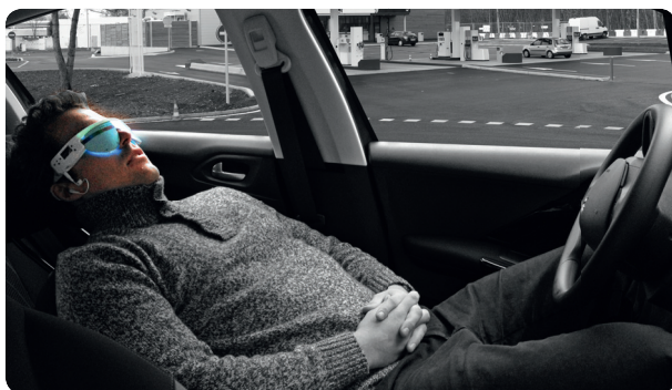
Récupération sur aire de repos

Naturellement vous pouvez utiliser le PSiO chaque fois que le besoin de détente ou de récupération se fait sentir.