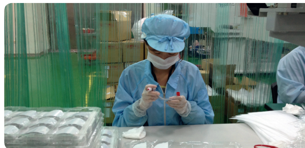
Fabrication en laboratoires de hautes technologies

A l'inverse des médicaments, cette méthode a prouvé après 20 ans de pratique qu'il n'y a aucun effet secondaire. PSiO a d'ailleurs obtenu le certificat d'innocuité totale pour les yeux par le Laboratoire National Français de mesure (LNE).